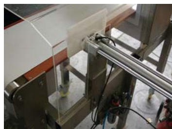
Sistemas de rechazo para productos contaminados.