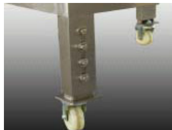
Práctico sistema de altura ajustable y ruedas auto-asegurables para transportador.