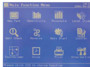
Amigable pantalla touch-screen.