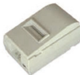
Sistema de reporte.

* Como resultado de nuestro interés por la mejora continua de nuestros productos y equipos, las especificaciones y características indicadas en el presente documento podrán ser modificadas en cualquier momento y sin previo aviso.