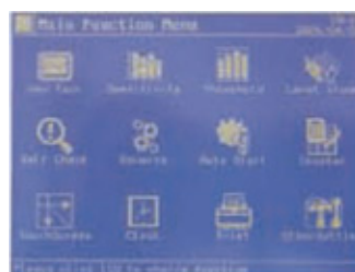
Menú del sistema.