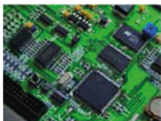
Circuito de control CPU de alta velocidad.