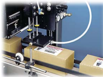
Impresores y Aplicadores de Etiquetas Codificado por radiofrecuencia

SOLUCIÓN TOTAL A LAS NECESIDADES DE SUS PRODUCTOS