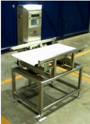
Verificador de peso en banda (CHECKWEIGHERS)

NUESTROS EQUIPOS ESTÁN FABRICADOS CON TECNOLOGÍA DE PUNTA Y TIENEN EL MEJOR COSTO-BENEFICIO DEL MERCADO. NUESTRO DEPARTAMENTO DE SERVICIO ESTÁ CAPACITADO DIRECTAMENTE POR LOS FABRICANTES EN CADA UNA DE SUS PLANTAS,