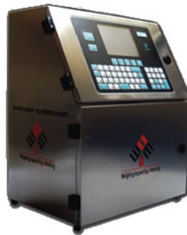
Codificadores de Alta y Baja Resolución CARÁCTER GRANDE Y PEQUEÑO