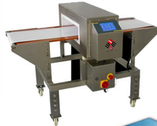
Detectores de Metales

SOLUCIÓN TOTAL A LAS NECESIDADES DE SUS PRODUCTOS