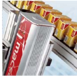
Sistema de codificado Láser