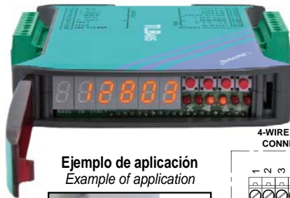
Ejemplo de aplicación Example of application