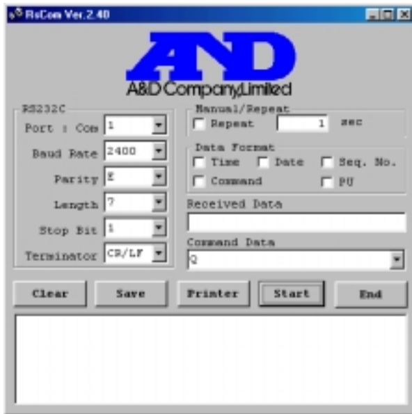
Ejemplo de la ventana RSCOM